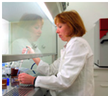
Grundlagenforschung / Kunststoffindustrie Forschungsinstitute